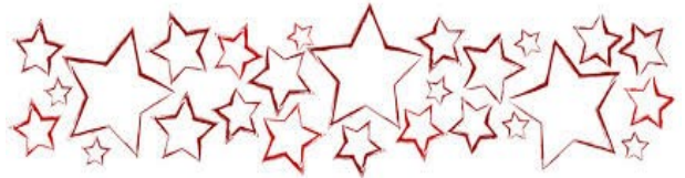
Herbert Weigel 2. Bürgermeister